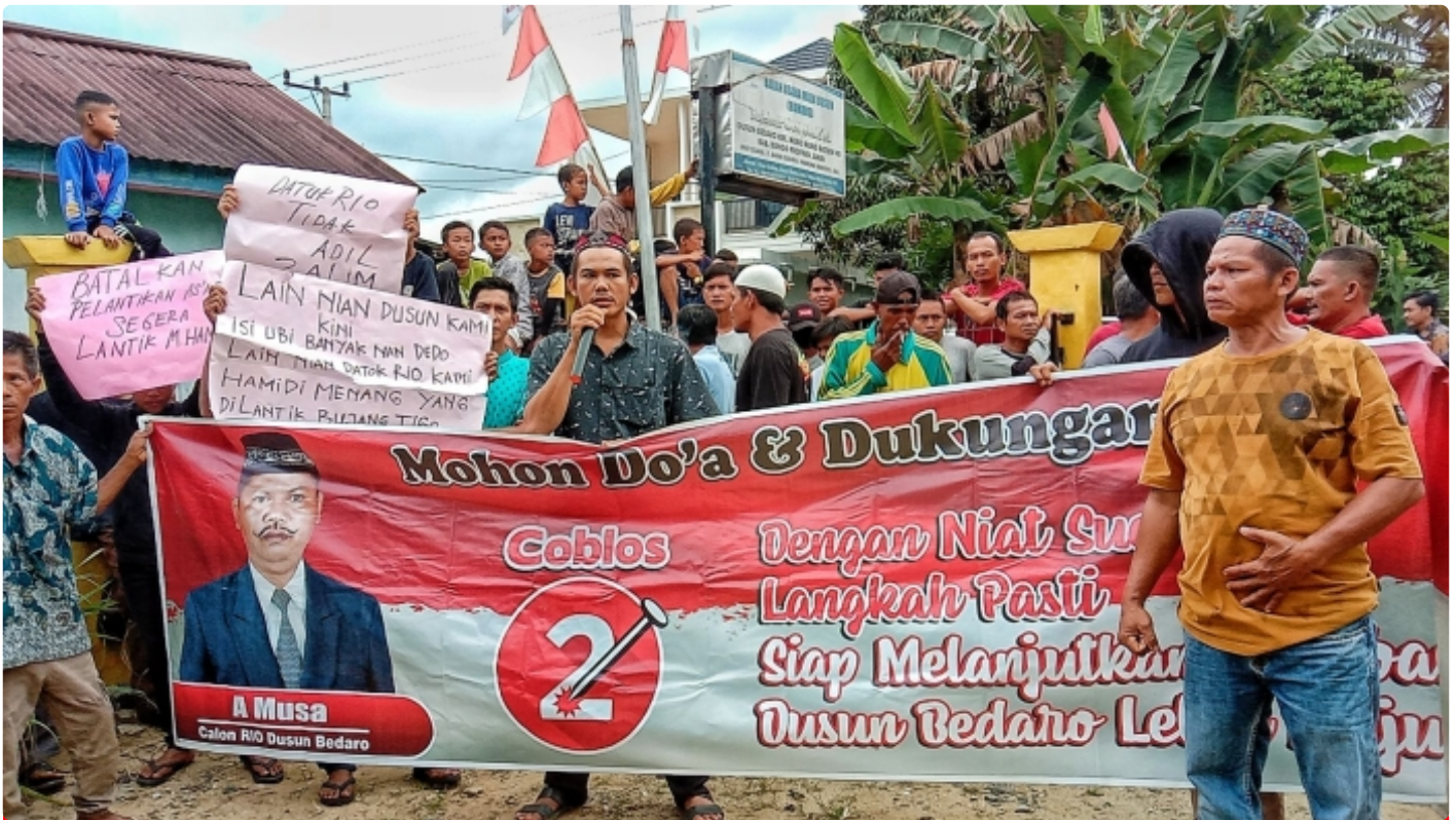
Demo Warga Didepan Kantor Rio Dusun Bedaro

Bungo - Rio Bedaro A Musa di Demo warga, diduga keputusannya dalam mengambil kebijakan dalam memutuskan selaku Sekdus Bedaro dinilai tidak profesional, terkesan memihak disalah satu kandidat. Kejadian ini berlangsung di depan kantor Rio Dusun Bedaro, kec muko-muko Bathin VII, Bungo, Jambi , Jum'at (23/12/2022).